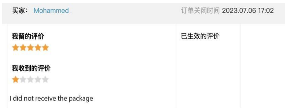
材料 3: FIRADA 买家评论原文