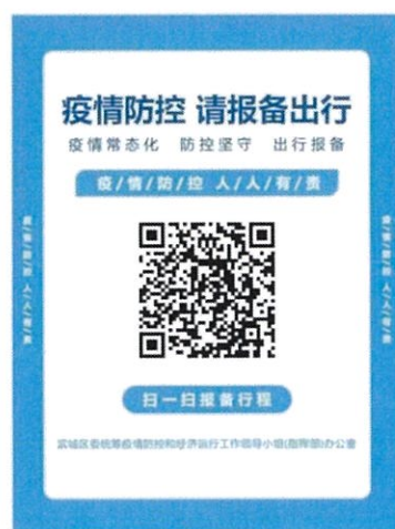
入滨返滨报备二维码

存在以下情形的人员不得参赛：确诊病例、疑似病例、无症状感染者和尚在隔离观察期的密切接触者、次密接；7 天内有发生本土疫情地区或 10 天内有境外旅居史的；居住社区 10 天内发生疫情的；近 7 天有发热、咳嗽等症状未痊愈的，未排除传染病及身体不适者。