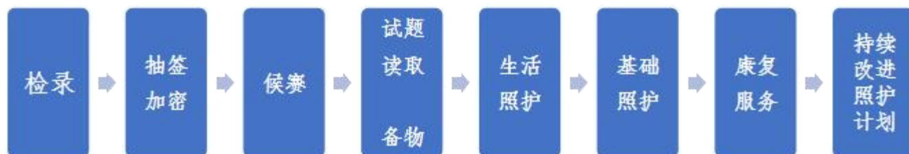
图2 参赛选手竞赛流程图

各参赛选手完成试题读取、备物后，持赛题案例、用物依次进入生活照护、基础照护、康复服务三个赛室，最后进入持续改进照护计划赛室。第一天、第二天竞赛流程一致。