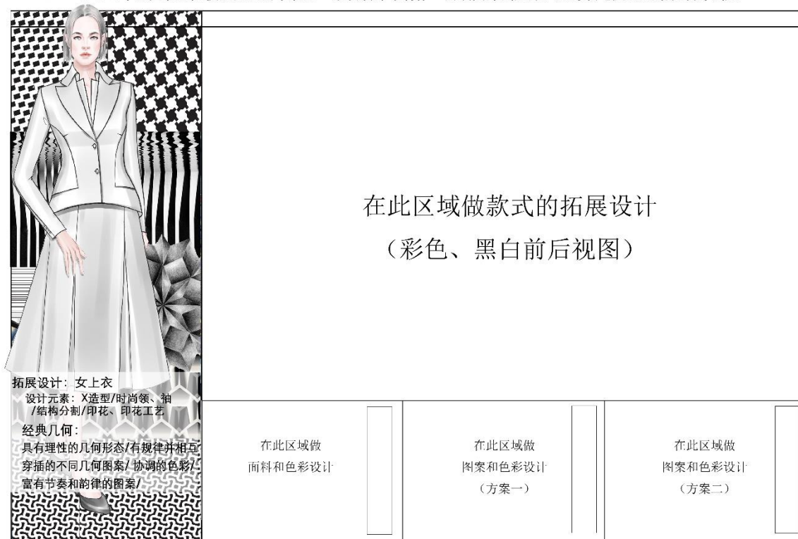
《2019年全国职业院校技能大赛中职组“服装设计与制作”赛项实操题库》女时装电脑款式拓展设计试题