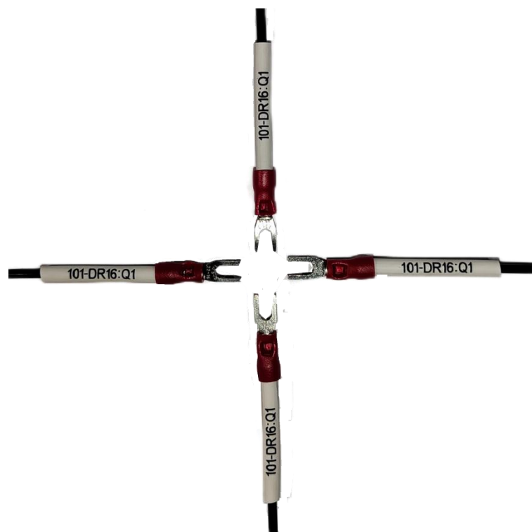
图4 号码管方向示意图

（2）在压接接线端子时，剥开的线芯插入接线端子套时，将所有的线芯全部插入端子中；采用压线钳压接接线端子时，应使压痕在接线端子套的底部（反面），压接后，压接部位不允许有导线外露。如图5所示。