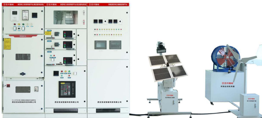
图1 YC-NTPS01新型电力系统技术与应用平台

赛项平台主要由新能源发电及储能控制平台、新型电力系统网络平台及新型电力系统仿真系统组成。如下图1所示：