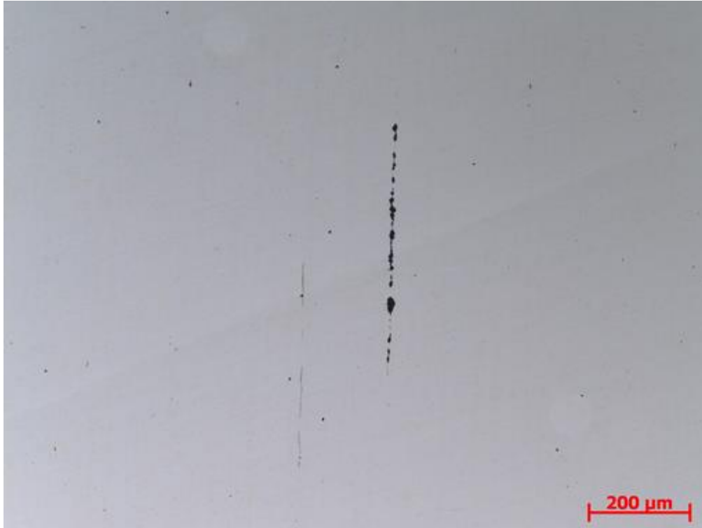
图 2 金相显微图片