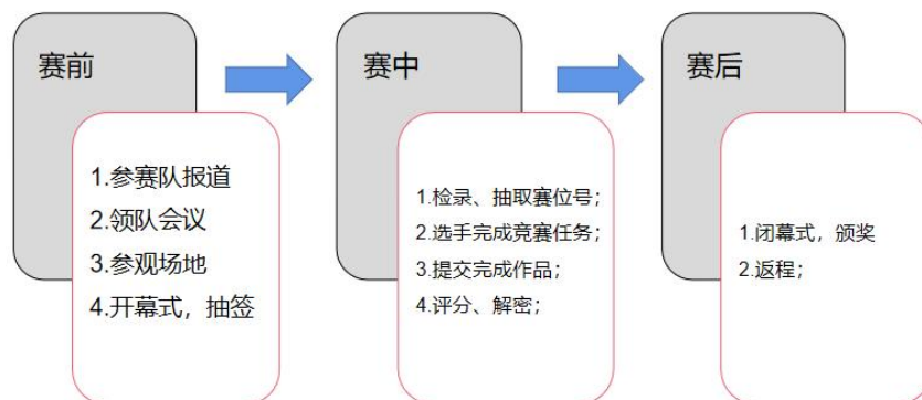
图 1 竞赛流程图