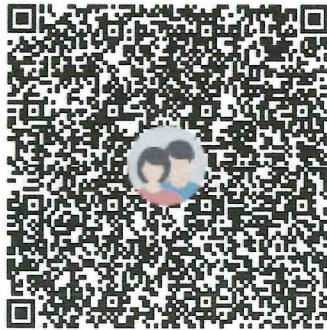
2023年国赛中式烹饪赛项（中职组）领队群

2. 请各参赛队领队，于7月8日前加入“ 2023年国赛中式烹饪赛项（中职组）领队 ”QQ群(群号：437495762)，以便接收各类比赛通知，申请入群的验证信息为“学校+姓名”，否则不予通过，请领队进群后务必修改名称为“学校+姓名+手机号码”。