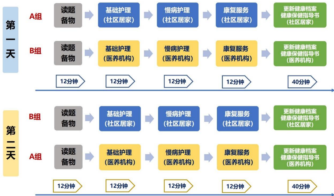
图 1 老年护理与保健场景、模块流程图