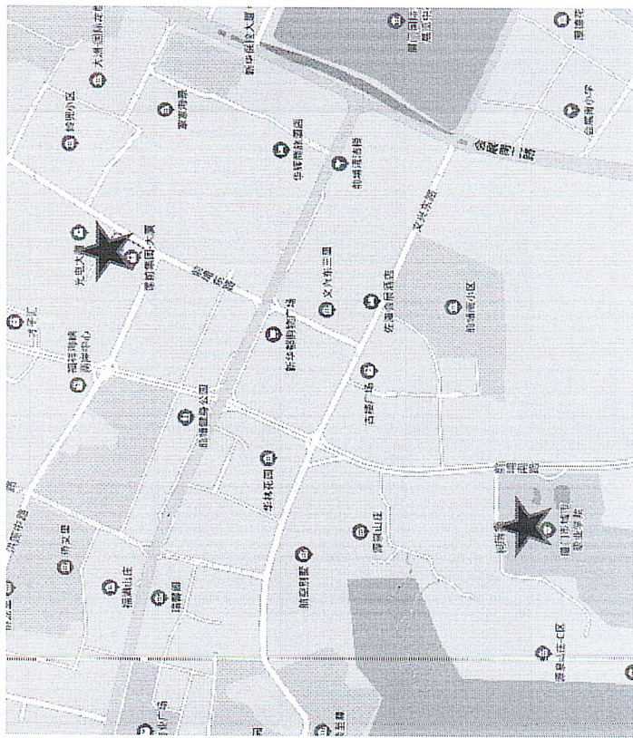
附件 3. 交通路线