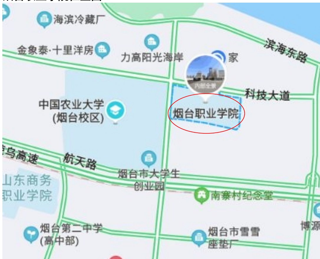
图 2 烟台职业学院位置图