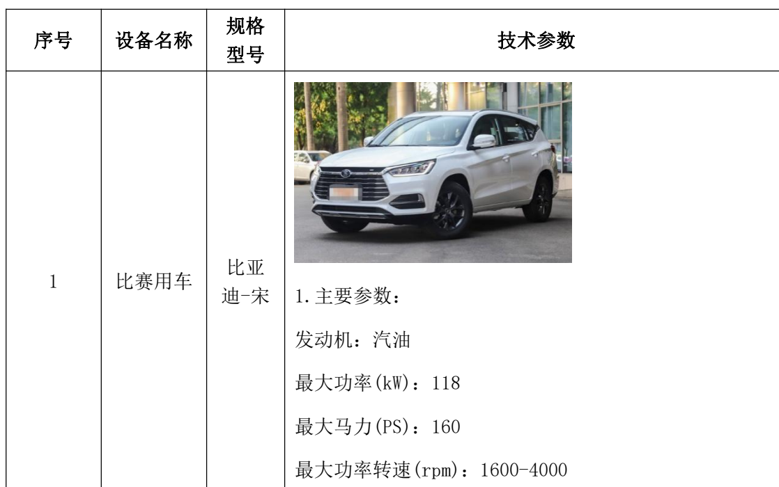
表 10 模块 B 汽车电气系统检修模块竞赛设备