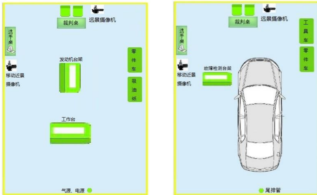
(a) 模块 A 竞赛工位

比赛场地应安装尾气抽排系统或尾气抽排净化装置，工位应有工作灯及插座（灯鼓）、气管（气鼓），模块 A 竞赛工位如图 1（a）所示，模块 B 竞赛工位如图 1（b）所示。腾讯会议外接广角摄像头及远景摄像机在工位前方一侧上方，拍摄工位全景；近景摄像机为移动摄像，拍摄实操过程细节。