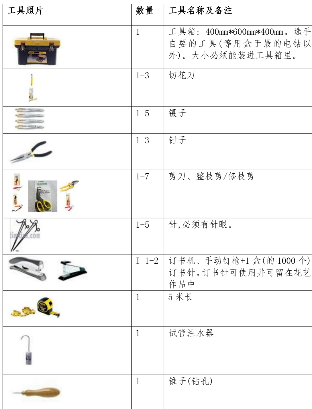
表 8 选手自备设备清单