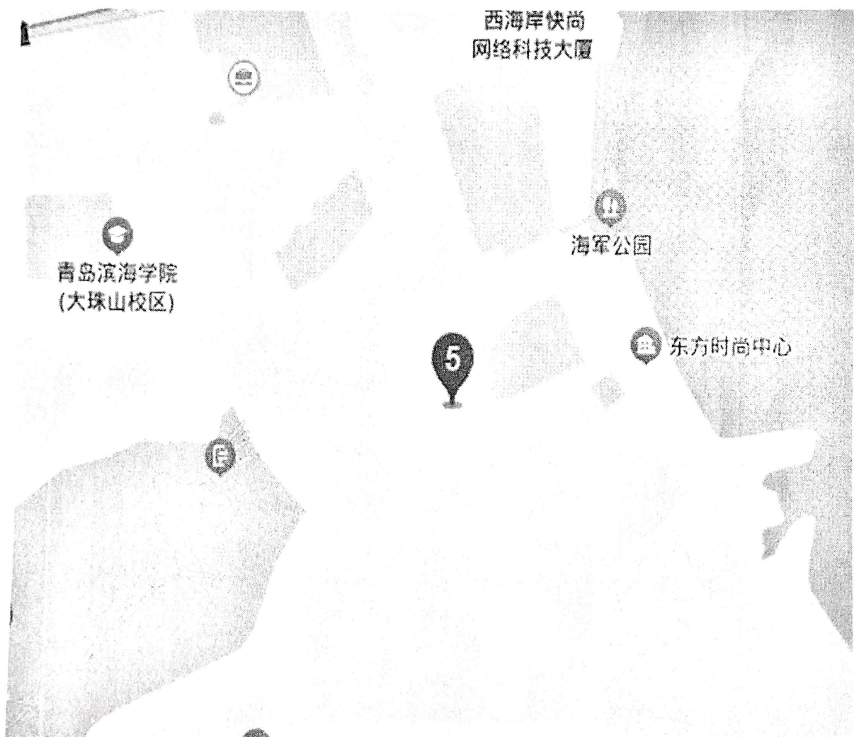
青岛君亭设计酒店地理位置图