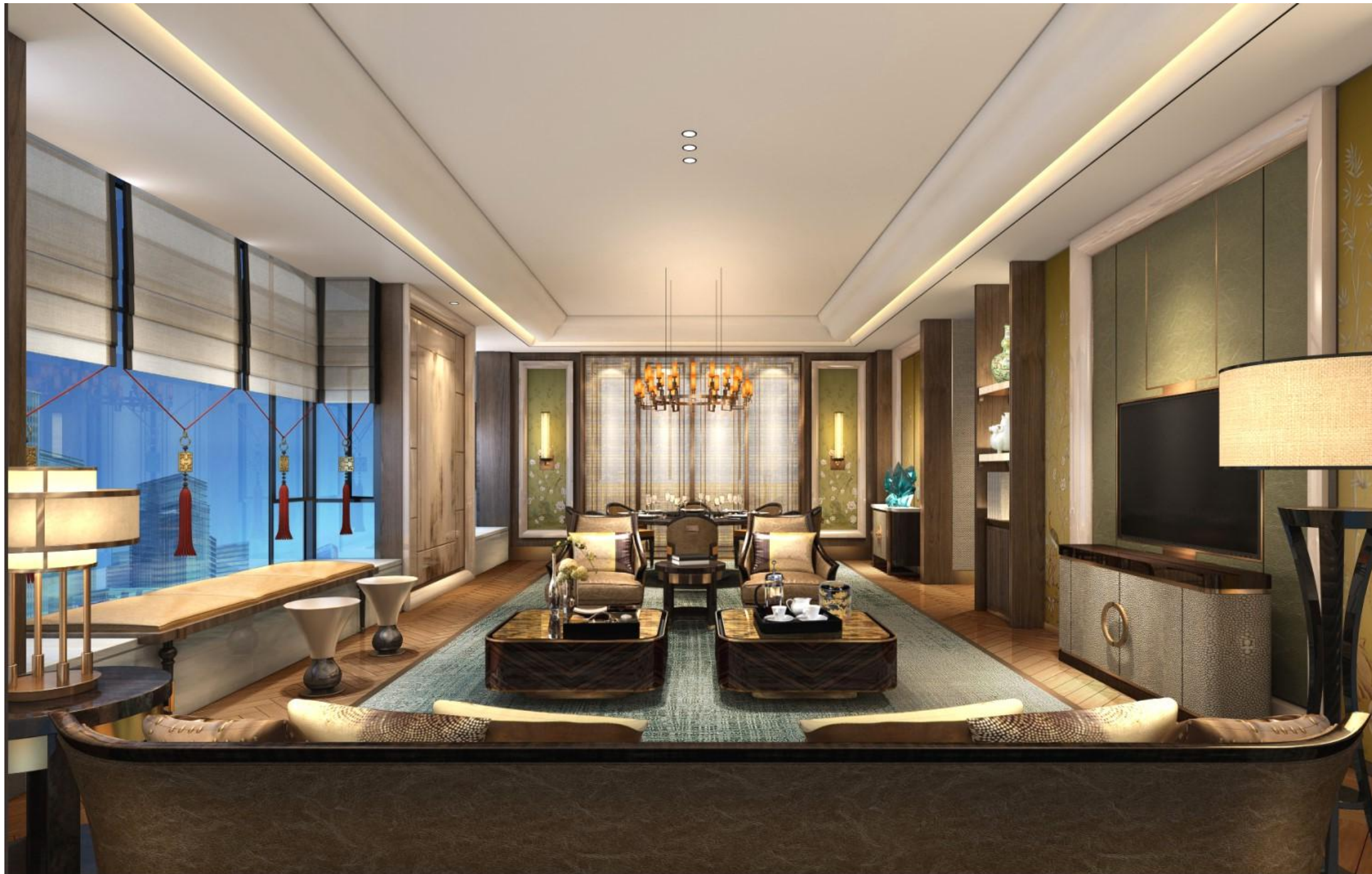
客餐厅参考效果图1