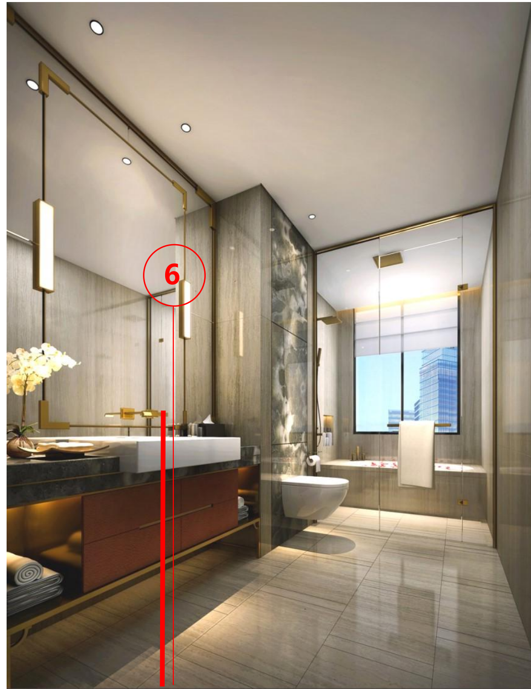
主卫生间节点剖切位置图