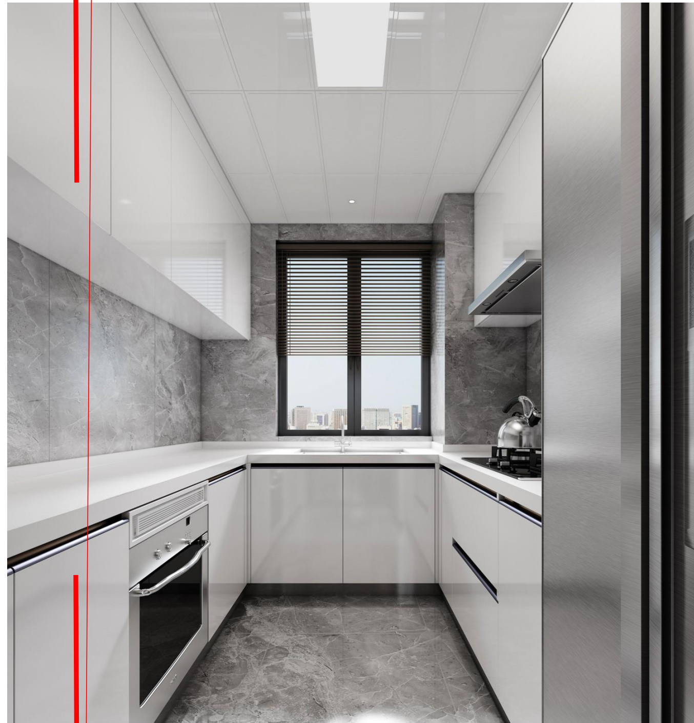
厨房节点剖切位置图