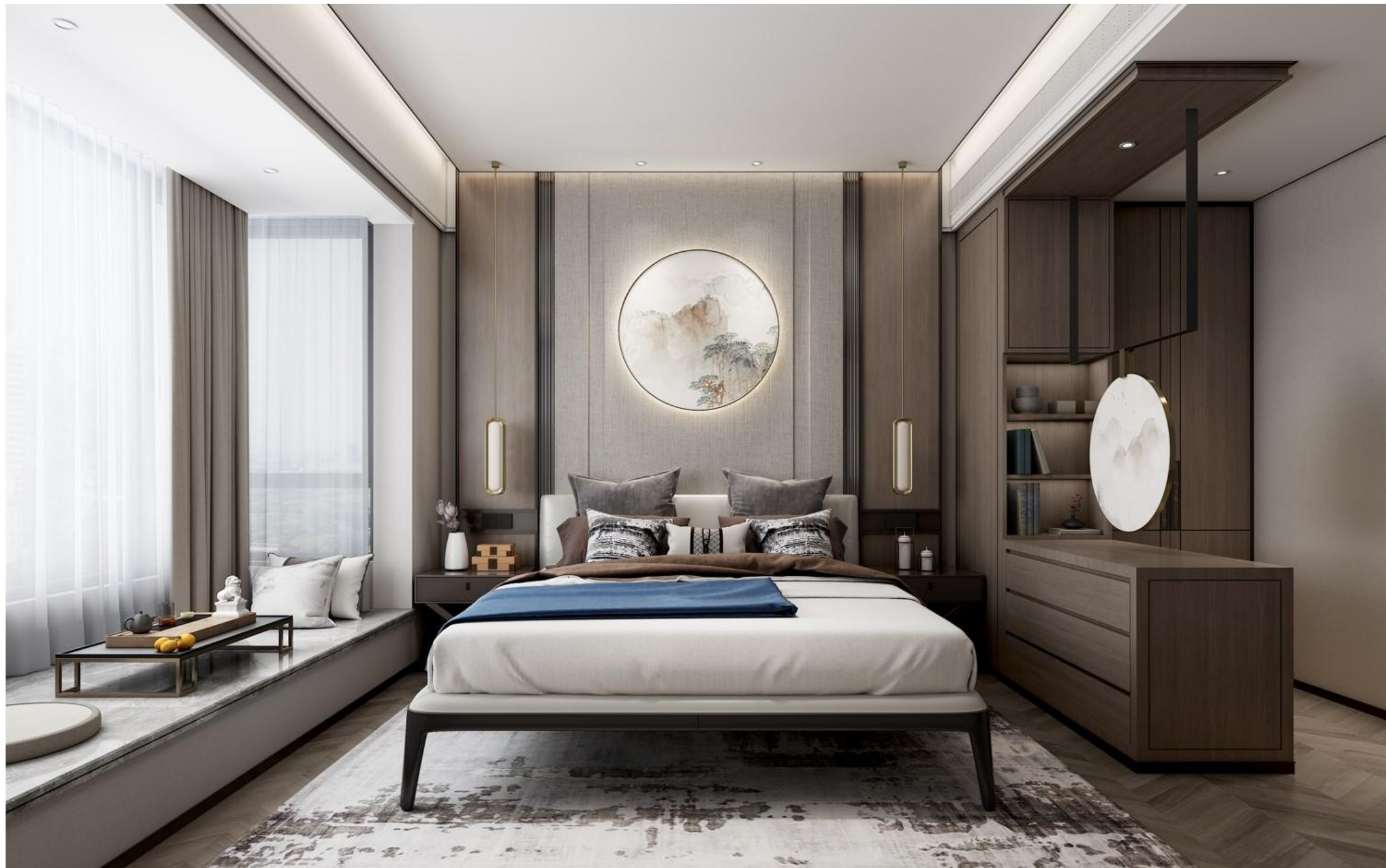
主卧室参考效果图