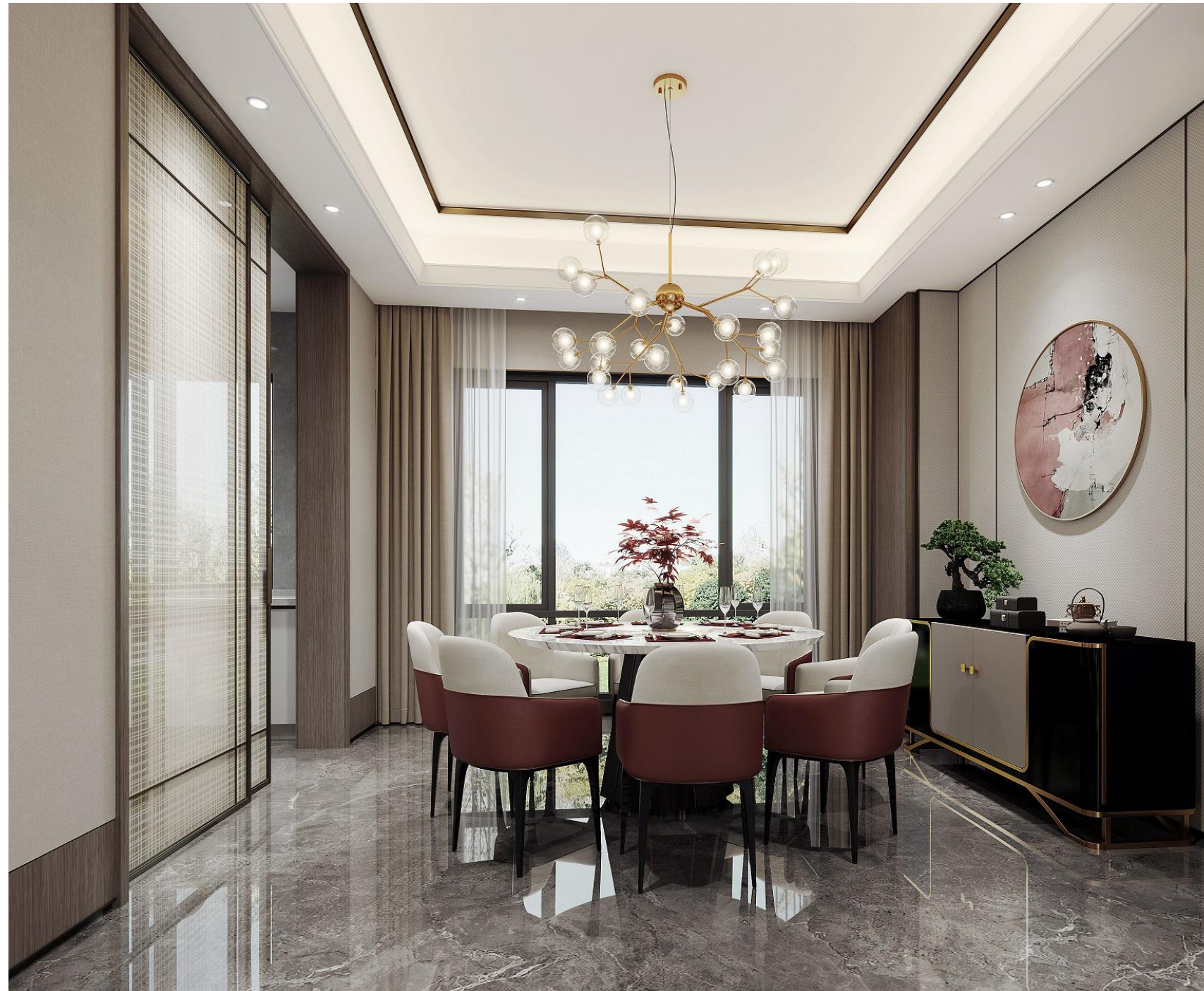
会客厅参考效果图