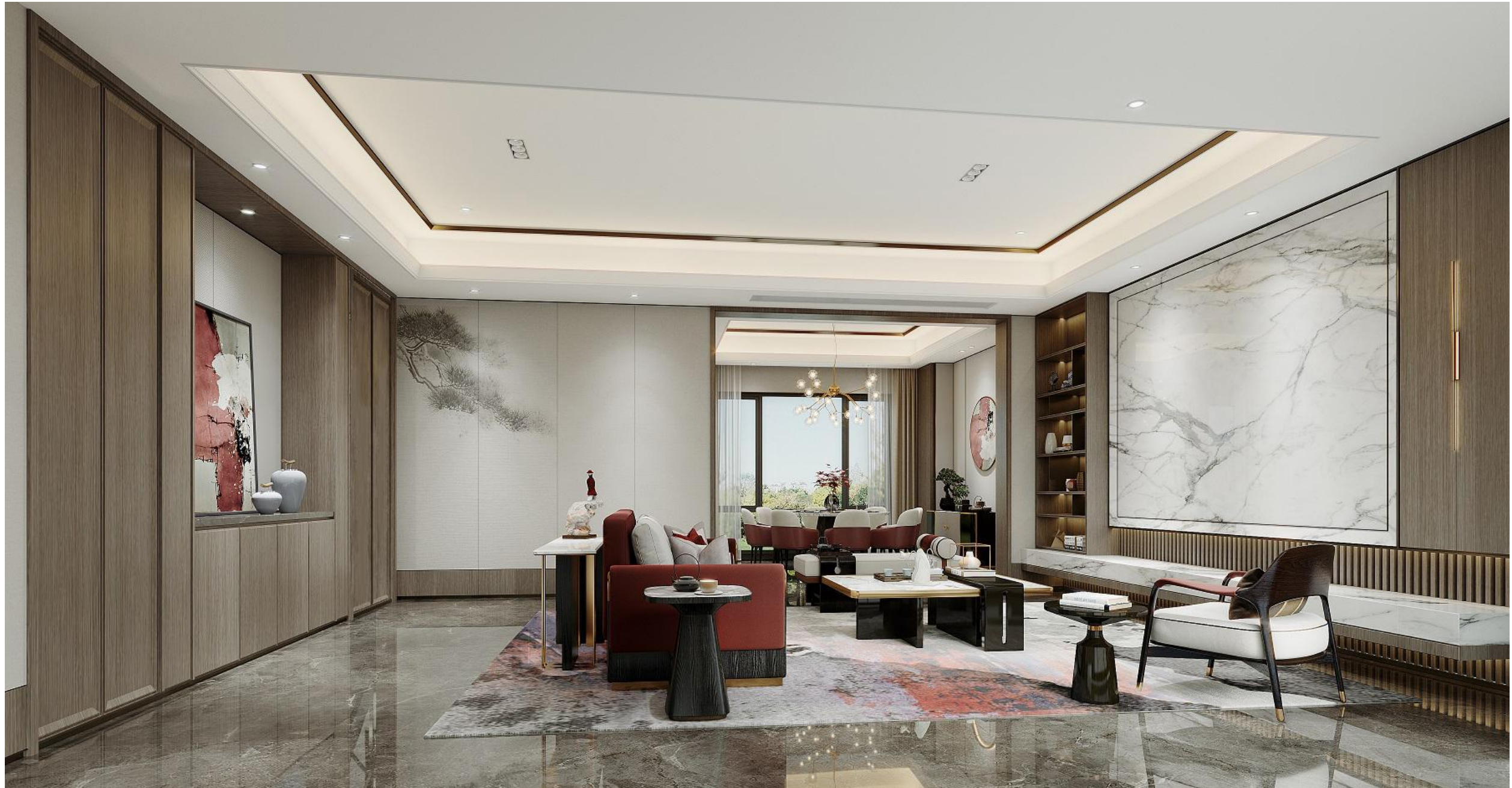
会客厅参考效果图