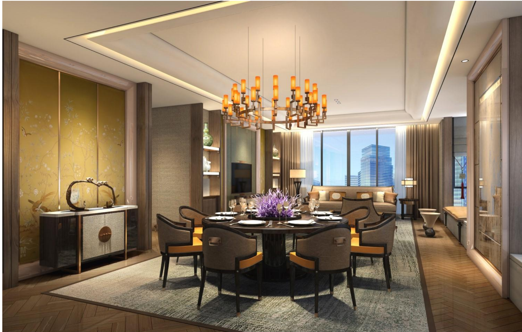
客餐厅参考效果图2