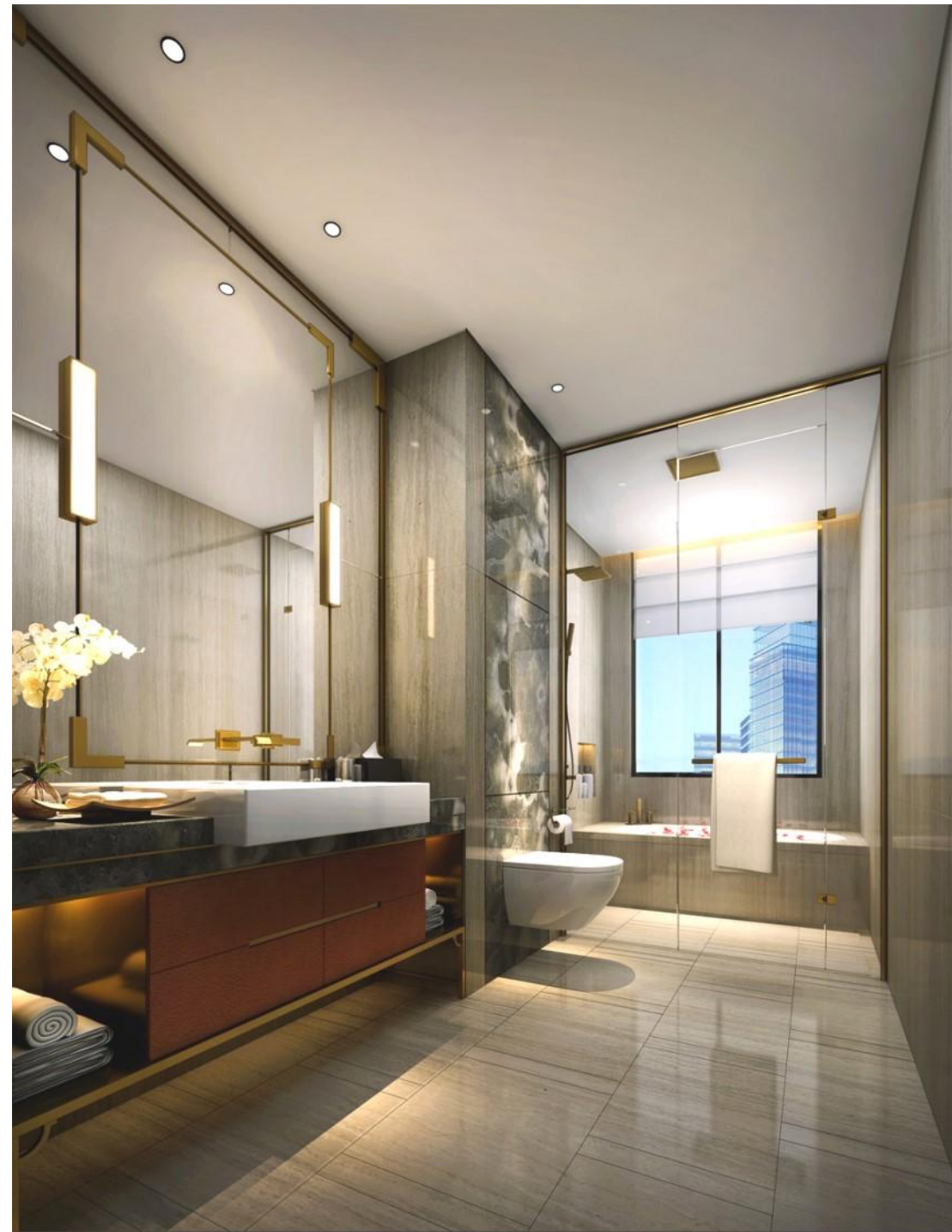
主卫生间参考效果图