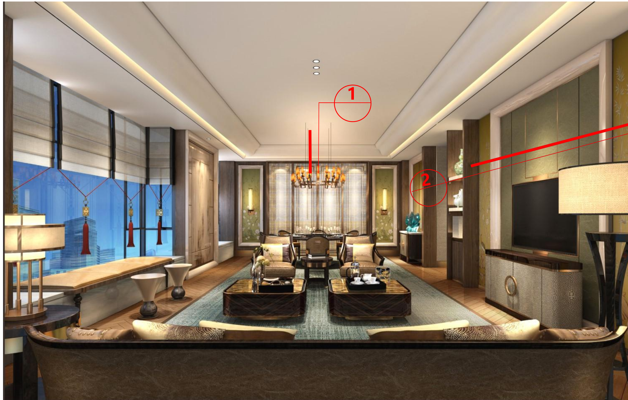
客厅节点剖切位置图 1--- 绘制顶面剖切节点 2--- 绘制墙面剖切节点