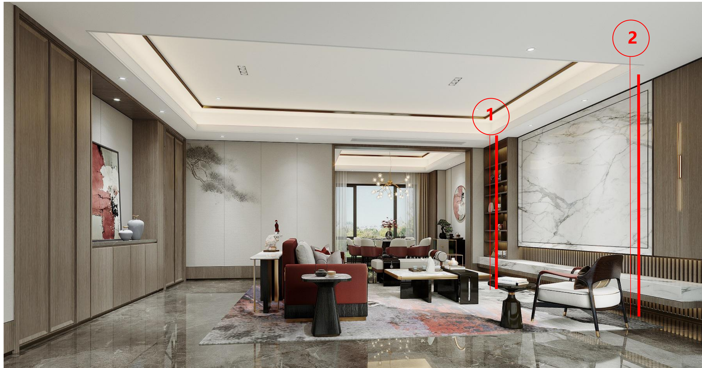
会客厅剖切位置图