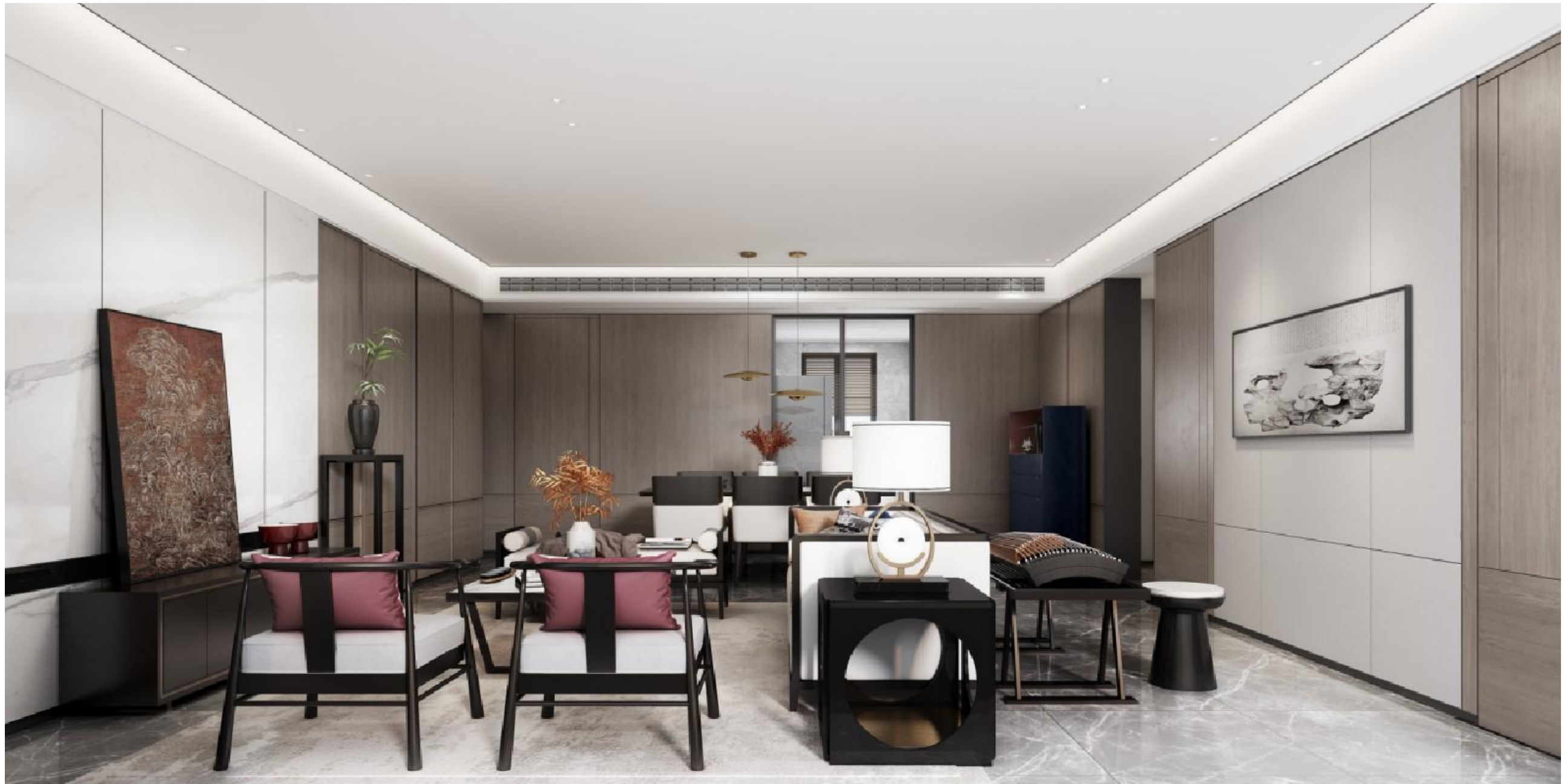
客餐厅参考效果图