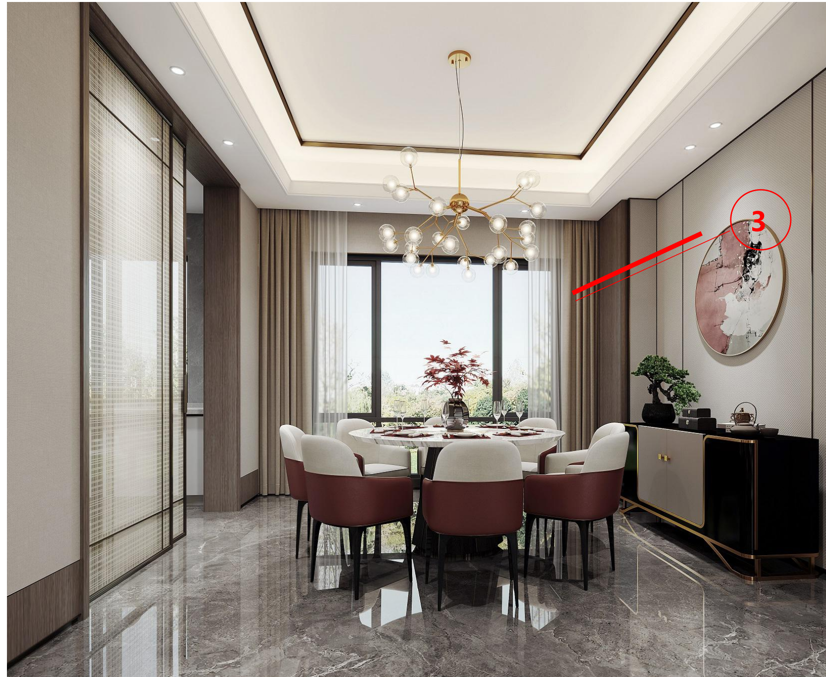
会客厅剖切位置图