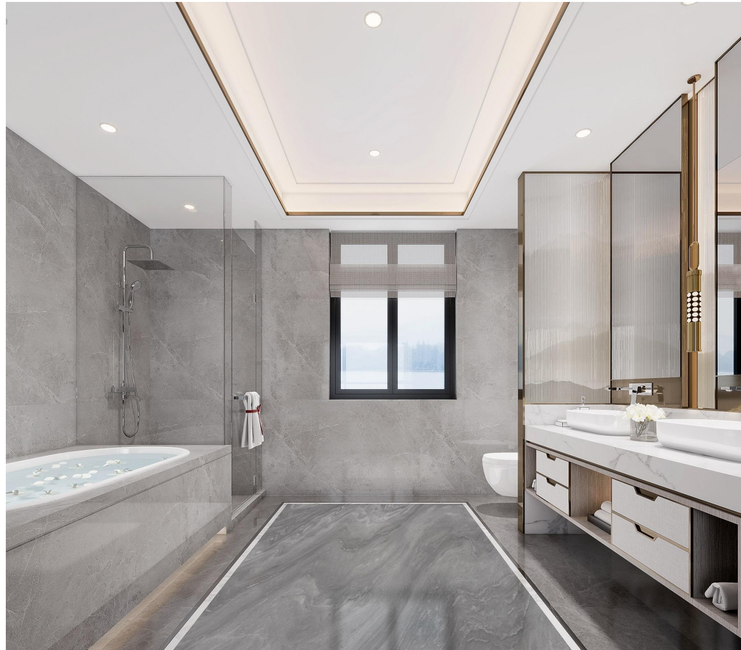
卫生间参考效果图