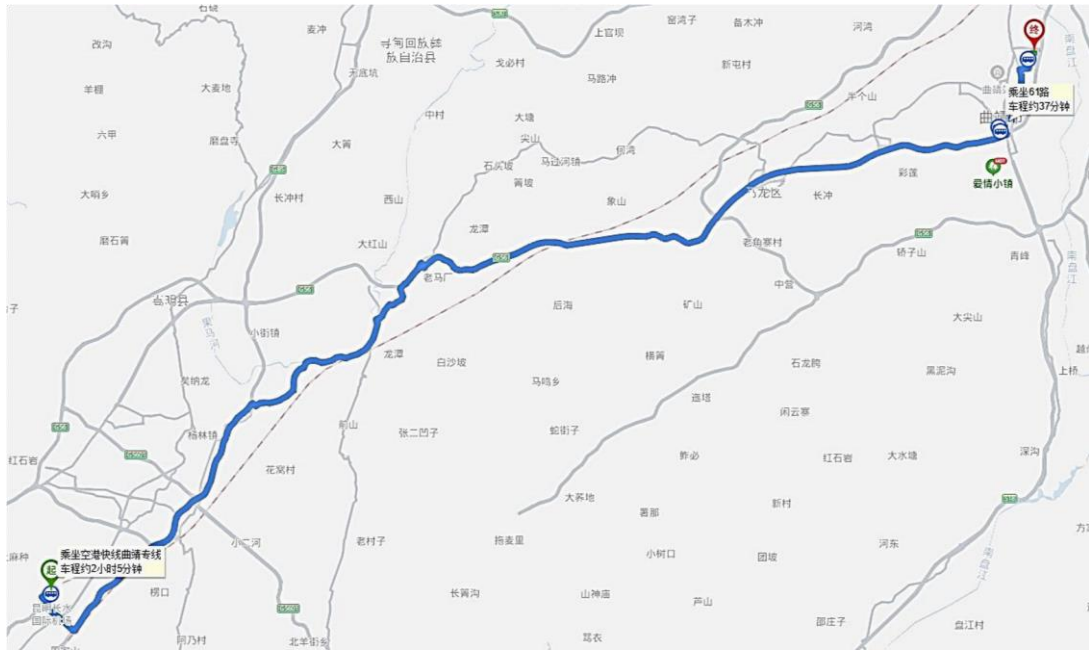
图 1 昆明长水机场到云南能源职业技术学院麒麟校区交通路线图