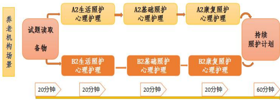
图1 竞赛场景、模块流程图