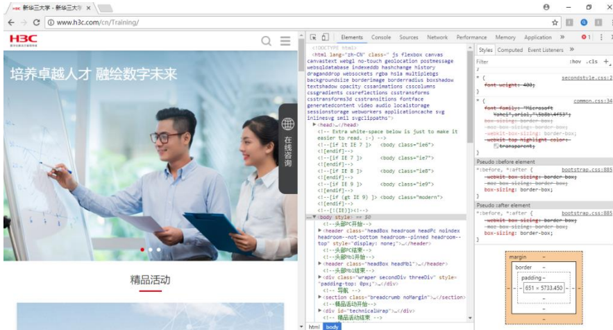
( 示例图 1 )

2) 检查网站：点击 Network、勾选 Preserve log、点击 Doc、点击清理按钮、刷新页面、点击 Response，在 Response 查看所需内容。